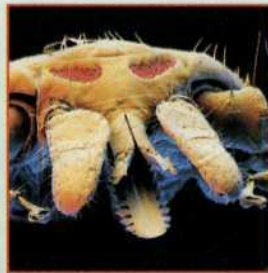
Клещ под микроскопом

Если клещ присосался , нужно смазать его маслом, жиром, керосином или накрыть его открытой горловиной флакона с водой на 10-15 мин., чтобы закрыть дыхальце клеща, дожидаясь, когда он задохнётся, после чего осторожным раскачивающим движением извлечь его из тела. Не рекомендуется интенсивно прижигать его одеколоном или спиртом — это может привести к гибели и высыханию клеща, что осложнит его удаление. Имея навыки, можно удалить клеща ниткой, сделав петлю и растягивая нитки в разные стороны. Затем медленными движениями раскачивают клеща и вытаскивают. Рану обрабатывают йодом или спиртом. Руки промывают с мылом.