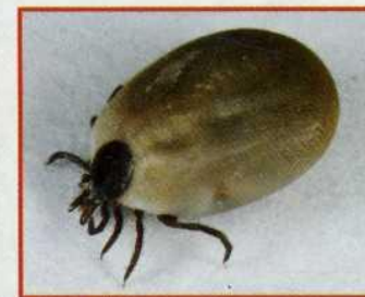
Самка клеща после кровососания