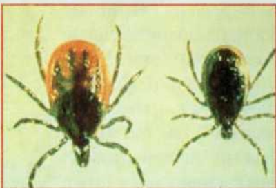
Самка и самец таёжного клеща